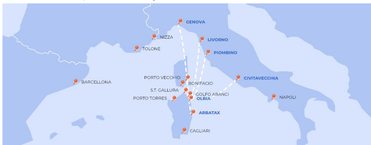
Mapa delle più comuni tratte tra Italia e Sardegna

I maggiori porti italiani hanno un collegamento con la Sardegna, specialmente d'estate. Quindi che voi viviate al nord, centro o sud, troverete sempre l'alternativa adatta a voi. Tra le principali città da cui partire ci sono Genova, Livorno, Piombino e Civitavecchia che vi porteranno o ad Olbia o ad Arbatax. I tempi di percorrenza e i costi dipendono ovviamente dal porto di partenza e dalla stagione. Se volete sempre essere aggiornati sui prezzi per raggiungere la Sardegna in traghetto, vi consiglio questo sito web. Per il vostro itinerario ho scelto la tratta Civitavecchia-Olbia nelle date dal 1 al 15 Giugno (bassa stagione). I tempi di percorrenza sono di 5h30 se scegliete di viaggiare di giorno, 8h se volete viaggiare di notte. Il costo per un viaggio A/R per un camper di medie dimensioni è di circa 250 euro. Ovviamente, potete sempre prendere in condivisione un camper direttamente in Sardegna. Un'ottima scelta se volete risparmiare sul traghetto!