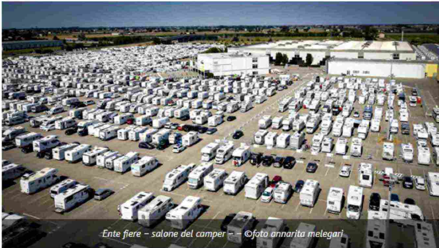
Ente fiere – salone del camper – ©foto annarita melegari

Il turismo open air si evolve per rispondere a richieste sempre più inclusive. I veicoli ricreazionali sono sempre più connessi e attrezzati anche per le persone con disabilità, permettendo a tutti di godere della libertà e del contatto con la natura.